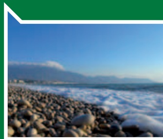
Пляж дель Альбир

Расположены в 18 км от Бенидорма. Именно отсюда берет свой исток река Альгар. Это место славится природным бассейном и живописными водопадами, своими пешеходными маршрутами (в ходе которых вы найдете множество редких ароматических растений) и прекрасным ботаническим садом. Здесь царит уникальный влажный микроклимат, поэтому этот парк охраняется государством.