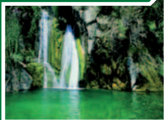
Источники дель Альгар